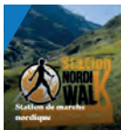
Station de marche nordique