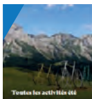
Toutes les activités été