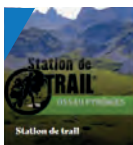
Station de trail