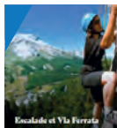
Escalade et Via Ferrata