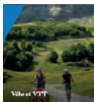
Velo et VTT